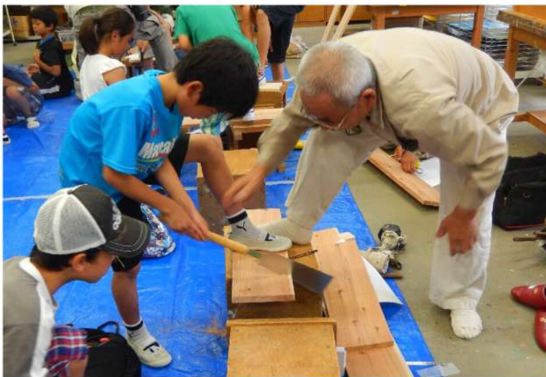
サマースクールでの工作の様子

なお、事前予約制となっておりますので、必ず電話予約の上、4P目の申込書をFAXして下さい。