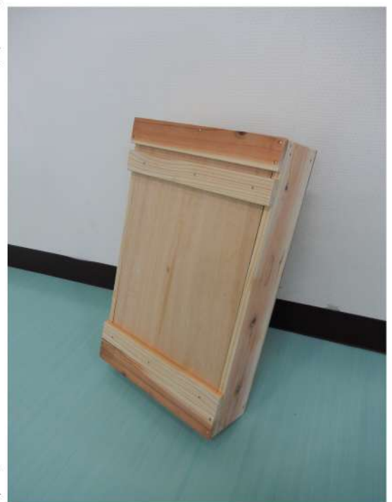
写真はイメージ図

内容は、木板を図面を見ながら「墨付け」・「木取り」・「加工」まで挑戦していただきます。もちろん、大工さんが講師としてお教えしますが、出来る限り親子で頑張ってみてください。