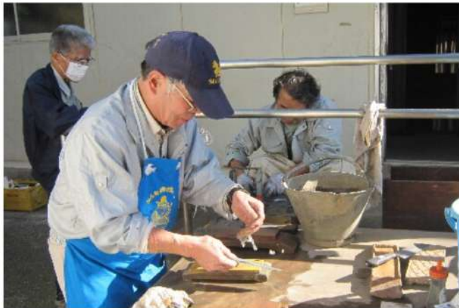
毎回好評な包丁とき

各会場の住宅デー開催日は右表の通りです。是非お近くの会場へ、ご家族ご友人お誘いあわせの上、お気軽にご来場下さい。催し物・会場の詳しい場所など、ご不明な点は「東京土建世田谷支部」(03-3413-3020)までお問い合わせ下さい。