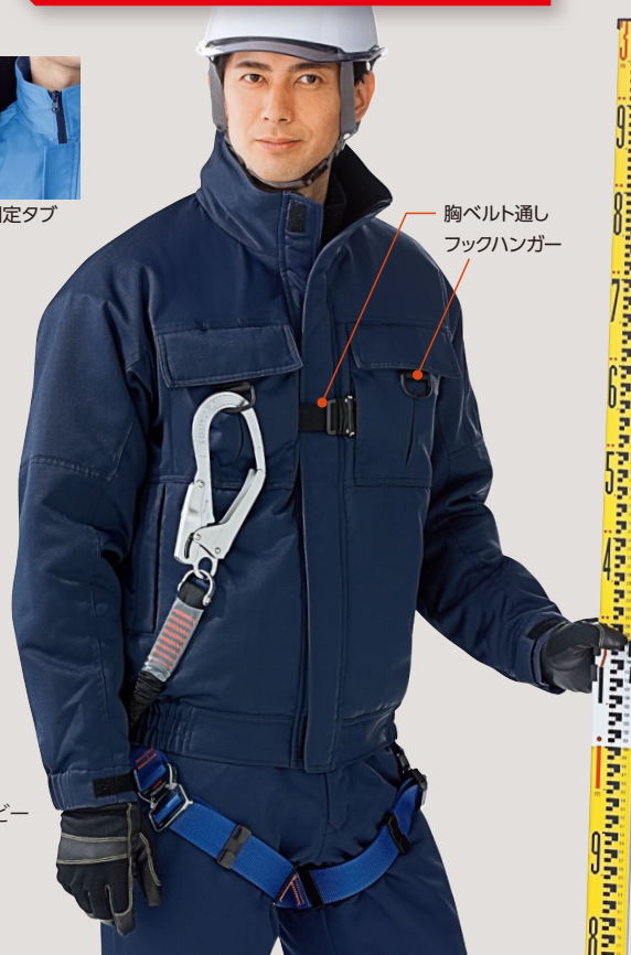
胸ベルト通し フックハンガー