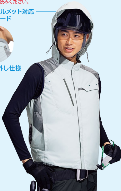
WEV761 上 シルバーグレー