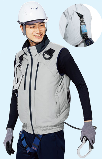
WEV71 上 シルバーグレー