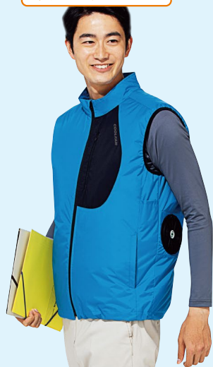
WEV83 上 ターコイズブルー