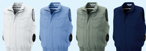
WEV161上 シルバークレイ WEV163上 ライトブルー WEV166上 スモークグリーン WEV167上 ネイビー