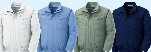
WE161上 シルバークレイ WE163上 ライトブルー WE166上 スモークグリーン WE167上 ネイビー