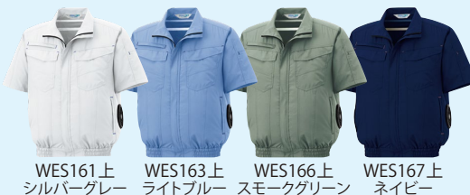
WE161上 シルバークレイ WES163上 ライトブルー WES166上 スモークグリーン WES167上 ネイビー

大容量 アイスパック ポケット 保冷剤を使うことで、 冷たい空気を循環で きます。 ※ポケットサイズ(最小) 幅：20cm、深さ：22cm ×2個